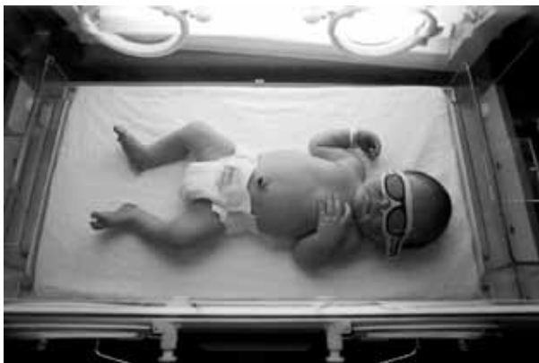
在NICU裏寶寶接受特別的燈照射 ‘太陽眼鏡’保護寶寶的眼睛